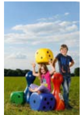
Nürnberg, Spielearchiv

Nürnberg (FR/869 Zeichen). Nürnberg ist bekannt als Hochburg der Spieleproduktion und nicht umsonst gilt die alljährliche Spielwarenmesse als Weltleiterschau der Branche. Allerdings ist die Messe nur den Fachbesuchern vorbehalten – dafür kommt jeder, der gerne spielt, beim Nürnberger Spielefest auf seine Kosten. Vom 28. Januar bis 1. Februar 2016 kann man im Haus Eckstein zu Füßen der Nürnberger Burg mehr als 800 Brett- und Kartenspiele ausprobieren sowie die aktuellen Neuheiten testen. Geöffnet hat die Spieltheke jeweils nachmittags und abends. Workshops laden zur Vertiefung ein: Einer widmet sich gezielt den Messeneuheiten, ein anderer läuft als Vorausscheidung der „Siedler von Catan“-Meisterschaft. Bis Sonnenaufgang gezockt wird bei der „Langen Nacht des Spielens“ am 30. Januar 2016. Zudem öffnet das Deutsche Spielearchiv im Pellerhaus seine Pforten ( www.nuernberger-spiele-fest.de ).