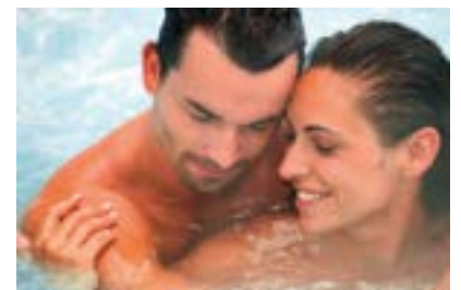
Bad Staffelstein, Winter-Arrangement „Champagner-Träume“

Bad Staffelstein (FR/687 Zeichen). Mit dem neuen Winterarrangement „Champagner-Träume“ genießt man in der „Obermain Therme Bad Staffelstein“ einen Tag lang Luxus pur. Bade- und Saunavergnügen im „ThermenMeer“ und dem jüngst erweiterten „SaunaLand“ sind die Basis für diesen Wohlfühltag, bei dem das festlichste aller Getränke die Hauptrolle spielt. Dabei wird eine winterliche Kaffee-Spezialität mit zwei Champagner-Trüffeln ebenso serviert wie ein Zwei-Gänge-Bademantel-Menü mit Champagner-Lauch-Cremesuppe und Schweinefilet im Wirsing-Blätterteig-Mantel auf Perlweinschaum. In der Variante „Premium“ wird das ganze durch eine Wellness-Massage mit elegant duftendem Massageöl „Champagner“ ergänzt ( www.obermaintherme.de ).