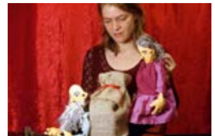
Bad Neustadt, Kindertheater