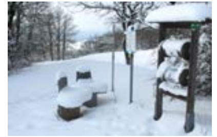
VGN, Winterwandern/Infotafel

Nürnberg (FR/1.434 Zeichen). Gerade im Winter, wenn Frost und Schnee die Landschaft überziehen, können Wanderungen besonders reizvoll sein. Speziell für die kalte Jahreszeit hat deshalb der Verkehrsverbund Großraum Nürnberg (VGN) zwei neue Wandertipps veröffentlicht. Beide Touren sind mit der Bahn gut angebunden und mit jeweils zwölf Kilometern Länge auch an kurzen Wintertagen zu bewältigen. Bei „Winter am Dillberg“ fährt man beispielsweise von Nürnberg aus mit der S3 in Richtung Neu- markt und erreicht in einer halben Stunde Pölling. Von dort geht es über den Schlossberg zum sagenumwobenen Dillberg. Dieser soll unterirdische Höhlen haben, auch mit dem Epplein-Schatz wird das Gebiet in Verbindung gebracht. Tatsache ist, dass hier ein Goldhut aus der Bronzezeit gefunden wurde. Am Ende der Tour bringt die S-Bahn Wanderer von Oberferrieden wieder zurück nach Nürnberg. Auch das legendäre „Walberla“ in der Fränkischen Schweiz ist im Winter einen Ausflug wert. Für die Tour „Schnee am Walberla“ fährt die R22 von Nürnberg aus im Stundentakt zum Ausgangspunkt nach Pinzberg und von Kirchenehrenbach wieder zurück. Wanderer dürfen nur nicht vergessen, vor Pinzberg die Haltewunschta- ste zu drücken, dann steht dem winterlichen Wandervergnügen mit einigen Höhenmetern nichts mehr im Wege. Die ausführlichen Beschreibungen der Wanderungen können als kostenlose Flyer über den VGN bezogen werden und stehen auch online mit GPS-Daten bereit ( www.vgn.de/freizeit ).