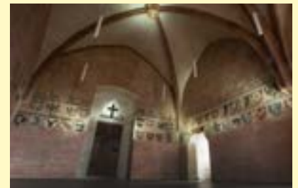
Lauf a.d. Pegnitz, Wappensaal

Kaiser Karl IV. lag besonders die Förderung der Wirtschaft und die Sicherung der Handelswege am Herzen. Deshalb deklarierte er die Verbindung zwischen seinen Residenzstädten Prag und Nürnberg als Reichsstraße. Die Orte an dieser „Goldenen Straße“ stattete Karl IV. mit zahlreichen Privilegien aus – und 2016 feiern sie den kaiserlichen Geburtstag mit vielen Veranstaltungen. Dazu zählen unter anderem die dreisprachige Ausstellung „Goldene Straße“ (26. April bis Oktober 2016) im Fränkischen Hopfenmuseum in Neunkirchen am Sand, „Musik für Kaiser und Könige“ in der Kirche St. Martin in Rückersdorf (17. Juni 2016), das Mittelaltermenü „Tafeln wie zu Zeiten Kaiser Karls IV.“ (1. bis 31. Juli 2016) in Hersbruck sowie die „Lange Laufer Kulturnacht“ (23. bis 24. Juli 2016) und die Laufer Märchentage (9. bis 11. September 2016) unter dem Motto „Entlang der Goldenen Straße“ ( www.hdbg.de/karl , www.bbkkult.net ).