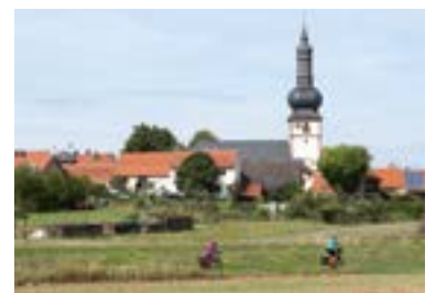
Radweg „Liebliches Taubertal – Der Klassiker“

Liebliches Taubertal (FR/859 Zeichen). Mit Sternen bewertet der Allgemeine Deutsche Fahrradclub (ADFC) die Qualität von Radrouten. Nur zwei Wege in Deutschland haben dabei aktuell die Höchstwertung von fünf Sternen: einer davon ist der Radweg „Liebliches Taubertal – Der Klassiker“. Nun ergab eine erneute Überprüfung durch den ADFC: Die Route ist top und darf sich auch weiterhin mit den fünf ADFC-Sternen schmücken. Der Weg folgt auf 100 Kilometern Länge dem Lauf der romantischen Tauber von Rothenburg ob der Tauber über Weikersheim, Bad Mergentheim und Taubertschheim bis Wertheim vorbei an Burgen, Schlössern, Klöstern und Kirchen. Bei fast jeder der Kriterien des ADFC erreichte dabei die Route die Bestmarke. Besonders angenehm, so der ADFC, sei die Routenführung überwiegend auf Wegen abseits des Kraftfahrzeugverkehrs und die gute Qualität der Oberfläche ( www.liebliches-taubertal.de ).