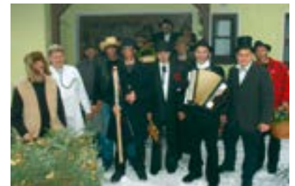
Frankenwald, „Pfefferer“

Frankenwald (FR/1.229 Zeichen). Wer im Frankenwald zum Jahreswechsel einem „Pfefferer“ begegnet, dem winkt im neuen Jahr Glück im Überfluss. Was so kulinarisch anmutet, ist einer der ältesten Bräuche des Frankenwalds. Zum Einsatz kommt dabei die „Pfeffergertn“, die aus frisch geschnittenen Tannen-, Weiden- oder Haselnusszweigen gebunden wird. Gepfeffert, also symbolisch geschlagen, werden bevorzugt die Damen, wenn in einigen Frankenwaldorten die Pfefferer von Haus zu Haus ziehen, um Glück zu wünschen und das Böse zu vertreiben. Bereits seit dem 18. Jahrhundert wird im Frankenwald die Rute für das Gute geschwungen. Man war davon überzeugt, dass sich beim Pfeffern Kraft, Gesundheit, Glück und sogar Fruchtbarkeit auf den Gepfefferten übertragen. Gleichzeitig soll alles Schlechte mit einem ordentlichen Rutenschwung verbannt werden. Allerdings hat der gepfefferte nachweihnachtliche Brauch noch einen anderen Grund: Sobald die gute Tat vollbracht ist, wagen die Damen des Hauses ein Tänzchen mit dem Pfefferer, der anschließend seinen Pfefferlohn erhält. Früher gab es einen Pfefferschnaps oder einen Pfefferkuchen, heute belohnt man die Pfefferer auch gerne mit einer kleinen fränkischen Brotzeit und ein paar Geldstücken ( www.frankenwald-tourismus.de ).