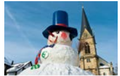
Bischofsgrün, Schneemann „Jakob“