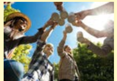
Fränkische Schweiz, Bierkultur und Biergenuss

Ein Jubiläum, das 2016 im gesamten Urlaubsland Franken gefeiert wird, ist der 500. Geburtstag des „Bayerischen Reinheitsgebots“. Am 23. April 1516 verkündete der bayerische Herzog Wilhelm IV. zusammen mit seinem jüngeren Bruder Ludwig X. in Ingolstadt, dass nichts anderes als Wasser, Hopfen und Malz für das Bierbrauen verwendet werden dürfe. Damit machten die beiden solch abenteuerlichen Bierzutaten wie Ruß, Kreidemehl und sogar Stechapfel und Fliegenpilz den Garaus. In Franken, das mit der weltweit größten Brauereidichte, seinen zahlreichen kleinen Privatbrauereien und Brauereigasthöfen und ungezählten Bierspezialitäten eine wahre „Heimat der Biere“ ist, wird bei zahlreichen Gelegenheiten auf das Jubiläum angestoßen.