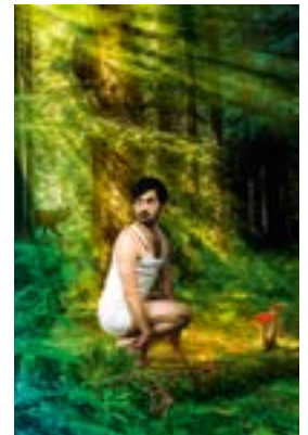
Nürnberg, Panoptikum „Vorstadtheater Bambi“

Nürnberg (FR/929 Zeichen). Wie es ist, wenn sich ein einsamer, alter Mann nur noch mit den Gegenständen in seiner Wohnung unterhält? Wenn Herr und Frau Jedermann über die Macht des Geldes stolpern? Und was macht Peter Pan zu einem aufregenden Zeitgenossen? All das und vieles mehr erfährt man vom 19. bis 24. Januar 2016 beim internationalen Kindertheaterfestival „Panoptikum“ in Nürnberg. Bereits zum neunten Mal geben sich Bühnen aus dem In- und Ausland ein Stell-Dich-Ein in der Stadt, die als Hochburg des Kinder- und Jugendtheaters gilt. Vergnügen ist nicht nur für das junge, sondern auch für das jung gebliebene Publikum garantiert: zum Beispiel beim Auftritt der „Zonzo Compagnie“ oder der spanischen „Farrés Brothers“. Insgesamt sind während des Festivals zehn Produktionen aus Bayern und zwölf Inszenierungen aus dem europäischen Ausland im gastgebenden „Theater Mumpitz“ sowie an sechs weiteren Spielorten zu sehen ( www.festival-panoptikum.de ).