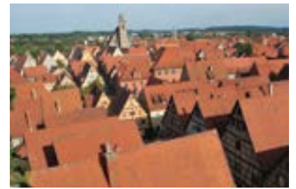
Dinkelsbühl, Stadtansicht