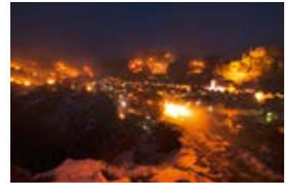
Pottenstein, Ewige Anbetung © Trykowski

Fränkische Schweiz (FR/1.014 Zeichen). Rund um den Jahreswechsel kann man in der Fränkischen Schweiz eine besonders schöne Tradition erleben: die Lichterfeste zum „Ende der Ewigen Anbetung“ unter anderem in Oberailsfeld (20. Dezember 2015), Nankendorf (31. Dezember 2015), Obertrubach (3. Januar 2016) und Pottenstein (6. Januar 2016). Gemeinsam ist diesen Orten nicht nur, dass hier der alte kirchliche Brauch der „Ewigen Anbetung“ gepflegt wird, sondern dass sie alle in ein Tal gebettet und von rund 150 Meter hohen Felswänden umgeben sind. Ort und Felsen werden für das Lichterfest mit unzähligen kleinen Holzfeuern bestückt. Diese werden entzündet, wenn nach Einbruch der Dunkelheit eine kirchliche Prozession das Ende der Anbetung markiert. Wenn sich der Zug durch den Ort bewegt, wird er von Glockengeläut und Musik begleitet. Die Stimmung, die währenddessen herrscht, ist aber vor allem deshalb so ergreifend, da dafür die Straßenlichter ausgeschaltet werden und einzig die vielen Feuer Licht spenden ( www.fraenkische-schweiz.com/weihnachtlich ).