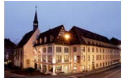
Würzburg, Bürgerspital Weinhaus

Würzburg (FR/1.094 Zeichen). 2016 feiert das Würzburger Bürgerspital zum Hl. Geist und mit ihm das gleichnamige Weingut seinen 700. Geburtstag. Bei der Gründung im Jahre 1316 ahnte Johannes von Steren sicherlich nicht, dass seine Stiftung 700 Jahre später nicht nur zu den ältesten Weinbau betreibenden Stiftungen der Welt, sondern auch zu Deutschlands Spitzenweingütern gehören wird. Die Charakterweine des Bürgerspitals aus berühmten Lagen wie „Würzburger Stein“ und „Würzburger Stein-Harfe“ sind ein Hochgenuss. Das bestätigen auch die vielen Auszeichnungen, die das Bürgerspital zieren: Zuletzt etwa kürte der renommierte „Gault Millau“ den Jubiläumswein des Bürgerspitals – ein 2014er Würzburger Stein Silvaner, Großes Gewächs – zum besten Silvaner Deutschlands. Das Jubiläum und der große Erfolg des Weinguts sind für das Bürgerspital ein hervorragender Anlass, um das ganze Jahr über gebührend zu feiern. Den Auftakt bildet das „Kelterhallen Weinfest“ am 1. und 2. April 2016, danach geht es weiter mit dem „Erlebnistag“ am 8. Mai 2016 und dem „Tag der offenen Tür“ am 21. Mai 2016 ( www.buergerspital.de/weinevents ).