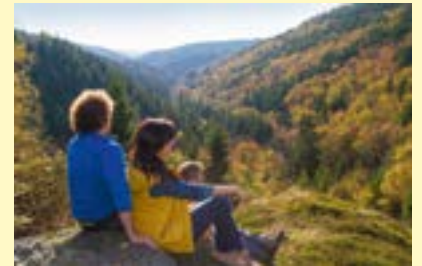
Frankenwald, Qualitätsregion Wanderbares Deutschland

Die überregionalen Radwege in Franken verbinden nicht nur traumhafte Landschaften, sondern auch die fränkischen Städte miteinander. Sie sind mit ihren prachtvollen Bauten, ihren Museen, ihren Konzerten und Festivals ein Spiegelbild der kulturellen Vielfalt und Kultur Frankens: darunter die Markgrafen-Städte Ansbach und Erlangen, die ehemals freien Reichsstädte Nürnberg, Schweinfurt, Rothenburg ob der Tauber und Dinkelsbühl, die von fürstbischöflicher Baulust geprägten Städte Aschaffenburg und Eichstätt, die ehemalige Residenzstadt Coburg, die Bierstadt Kulmbach und Fürth als „Stadt der 1.000 Baudenkmäler“. Drei fränkische Städte gehören zudem zum UNESCO-Welterbe: Bambergs Altstadt, Bayreuth mit dem Markgräflichen Opernhaus und Würzburg mit der fürstbischöflichen Residenz. Zusammen mit dem Obergermanisch-Raetischen Limes, der in großen Teilen durch Franken verläuft, liegen damit vier der sieben bayerischen UNESCO-Welterbestätten in Franken.