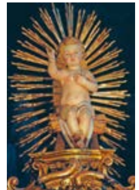
Bad Staffelstein, Jesukind in der Stiftskirche von Kloster Banz