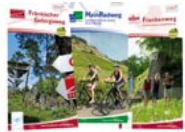
Franken, Tourenbegleiter