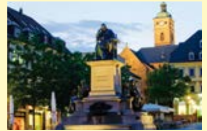
Schweinfurt, Rückert-Denkmal

Vom Mittelalter in die Zeit der Romantik führt der nächste fränkische Höhepunkt: 2016 jährt sich der Todestag des Dichters, Gelehrten und Orientalisten Friedrich Rückert zum 150. Mal. Rückert war ein „Weltpoet“ – doch seiner Heimat Franken tief verbunden. Seine Geburtsstadt Schweinfurt stellt ihn und sein Werk das ganze Jahr über in den Mittelpunkt. Dabei bringt vor allem die Literatúrausstellung „Der Weltpoet: Friedrich Rückert (1788-1866) – Dichter, Orientalist, Zeitkritiker“ in der Kunsthalle Schweinfurt (8. April bis 10. Juli 2016) den Besuchern Rückerts Zeit und Werk näher und zeigt gleichzeitig, wie aktuell viele seiner Gedanken heute noch sind. Im Lauf des Jahres zieht die Ausstellung in zwei weitere fränkische Städte, die in Rückerts Leben eine große Rolle spielten: Zu sehen ist sie im Stadtmuseum Erlangen (24. Juli bis 13. November 2016) und beim Kunstverein Coburg (14. Januar bis 17. April 2017). Schweinfurt, Erlangen und Coburg bieten wie die weiteren Rückert-Orte Oberlauringen, Hofheim i. UFr., Ebern, Rentweinsdorf, Bad Rodach, Seßlach und Neuses bei Coburg 2016 zahlreiche Rückert-Veranstaltungen ( www.schweinfurt360.de , www.rueckert-gesellschaft.de ).