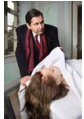
Bad Windsheim, Winterwandeltheater im Freilandmuseum

Bad Windsheim (FR/939 Zeichen). Vom 14. Januar bis zum 20. Februar 2016 steht immer donnerstags bis sonntags das Fränkische Freilandmuseum Bad Windsheim im Zeichen des „Winterwandeltheaters“. Dabei sitzen die Zuschauer nicht auf festen Plätzen, sondern wandeln über das Gelände des Museums, um das neue Stück „Fieberkurve“ zu genießen und sich im Rahmen des kulinarischen Arrangements „Kommunbrauhaus“ verwöhnen zu lassen. Passend dazu beginnt der Theaterrundgang neben dem Kommunbrauhaus des Museums am „Dorfplatz Rangau“, wo sich ein ehrgeiziger Hamburger Anwalt in einer kalten Winternacht auf die Suche nach seiner Ex-Verlobten macht und dabei in höchst seltsame Vorfälle im Dorf hineingezogen wird. Nach dem Theaterstück wärmen sich die Zuschauer im Gasthaus am Kommunbrauhaus bei einem Vier-Gänge-Menü wieder auf. Theater- und Restaurantbesuch sind als kulinarisches Arrangement für 45 Euro im Freilandtheater buchbar: Telefon 09106-924447 ( www.freilandtheater.de ).