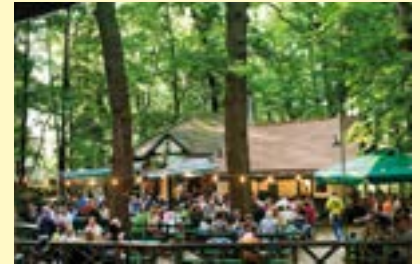
Forchheim, Bierkeller

Dabei soll nicht vergessen werden, dass Bier nur eine der kulinarischen Säulen im Genießerland Franken ist. Schließlich liebt man im Urlaubsland ebenso die köstlichen Frankenweine und die handfesten Genüsse. Das Qualitätsiegel „Franken – Wein.Schöner.Land!“ vereint Angebote rund um Reisen zum Frankenwein, die strengen Qualitätskriterien Stand halten.