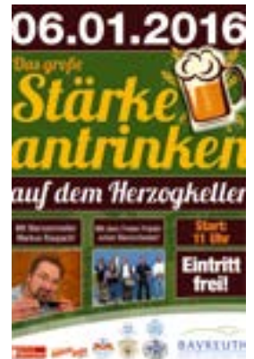
Bayreuth, „Stärke antrinken“