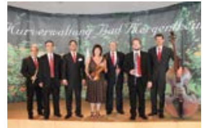
Bad Mergentheim, Silvesterkonzert