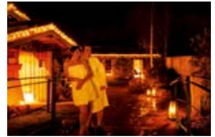
Bad Kissingen, Candlelight Night

Bad Kissingen (FR/1.378 Zeichen). Von der Weihnachtsgeschichte im Sandbad bis zum Saunaaufguss bei Kerzenschein: Bad Kissingen lädt im Winter mit Wellnessangeboten und der „KissSalis Therme“ zur Auszeit vom Alltag ein. Eines dieser Angebote ist das „Wintermärchen“ im Vier-Sterne-Wellnesshotel „Residence von Dapper“. Es beinhaltet zwei Übernachtungen im Komfortzimmer inklusive Verwöhnfrühstück und ein winterliches Drei-Gänge-Menü. Die Gäste entspannen bei einer Hot-Stone-Massage im neuen Spa-Bereich und besuchen die Bayerische Spielbank Bad Kissingen. Spezielle Übernachtungsangebote hält auch die Rehaklinik „Am Kurpark“ bereit. Bei „Weihnachtszeit in Franken“ (19. bis 22. Dezember 2015) genießt man unter anderem eine Ganzkörpermassage, einen Saunabesuch mit weihnachtlichen Düften und lauscht der Weihnachtsgeschichte, während man im warmen Sandbad liegt. Der „Jahresausklang“ (29. Dezember 2015 bis 1. Januar 2016) umfasst unter anderem eine Ganzkörpermassage und eine Weinprobe in Hammelburg, der ältesten Weinstadt Frankens. Immer einen Besuch wert ist in der kalten Jahreszeit die „KissSalis Therme“: Hier erstrahlt noch bis März 2016 jeden Donnerstag ab 17 Uhr der „Sauna-Park“ im Kerzenschein, was Lust auf die zahlreichen Sonderaufgüsse und Massagen macht. Sie genießt man etwa beim „Candlelight-Arrangement“ inklusive dreistündigem Thermen-aufenthalt und Candlelight-Massage ( www.badkissingen.de ).