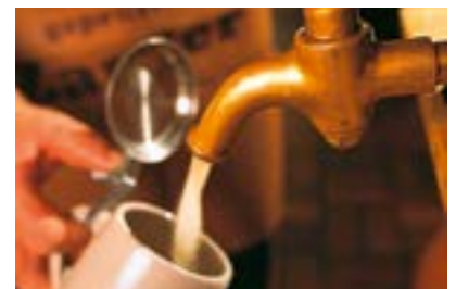
Frankenwald, Frisch gezapftes Bier

Frankenwald (FR/962 Zeichen). In der letzten der zwölf Raunächte vom 5. auf den 6. Januar werden auch im Frankenwald traditionell Kräfte für das neue Jahr gesammelt: beim „Stärk’ antrinken“. Um sich gegen die möglichen Widrigkeiten des kommenden Jahres zu wappnen, trinkt man sich im Kreis der Familie oder mit Freunden Kraft und Gesundheit – die Stärk’ – an. Gefeiert wird vielerorts in Gaststätten, doch auch zahlreiche Brauereien unterstützen den Brauch mit einem speziellen Starkbier, das für das „Stärk’ Antrinken“ besonders geeignet sein soll. In diesem Sinne braut auch das Mönchshof Bräuhaus in Kulmbach in der gläsernen Museumsbrauerei für die „Stärk“ seinen hellen Museumsbock. Es handelt sich um ein sehr helles Bockbier, das sehr hoch gegoren ist und dadurch seinen nicht zu vollen, ausgewogenen Geschmack erhält: perfekt, um bei fränkischen Spezialitäten aus der Bräuhaus-Küche und Live-Musik das „Stärk’ Antrinken“ genussvoll zu zelebrieren ( www.bayerisches-brauereiumuseum.de ).