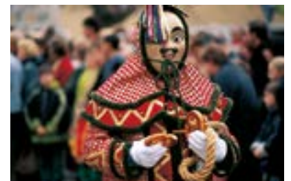
Kinding, Fosanege

Kinding (FR/1.087 Zeichen). Laut schnalzen die Peitschen – „Goaßln“ genannt – am Kindinger Marktplatz durch die Luft, wilde Gestalten mit Holzmasken necken die Besucher und verteilen Brezen und süße „Guatl“ unter den Zuschauern: Dieses Szenario herrscht wieder am 10. Januar 2016 in Kinding im Naturpark Altmühltal, wenn die Kindinger Fosanege zum „Anschnalzen“ einladen und damit nicht nur die Faschingsaison einläuten, sondern auch, wie es Tradition ist, den Winter vertreiben. Schließlich zählen die Figuren der Fosanege zu den Traditionsgestalten der fränkischen Fastnacht und sind bei den Faschingsumzügen ein besonderer Höhepunkt. Über den Ursprung dieser Gestalten mit ihren aufwendigen Kostümen und Masken gibt es mehrere Theorien. Der Brauch entstand entweder während der Pestzeit, hat sich aus dem mittelalterlichen Fastnachtstreiben entwickelt oder geht sogar auf vorchristliche Wurzeln zurück. Wer das „Anschnalzen“ verpassen sollte, kann die Fosanege mit ihren Goaßln bis zum Kehraus am Faschingsdienstag (9. Februar 2016) jeden Sonntag beim Schnalzen in der Ortsmitte sehen und hören ( www.fosanege.de ).