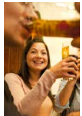
Bamberg, Brauereigaststätte

Bamberg (FR/826 Zeichen). In der Bierregion Bamberg wird das neue Jahr allenthalben mit dem Brauch des „Stärk' Antrinkens“ begangen. Zumeist wird der Brauch in den vielen kleinen, urigen Brauereiwirtschaften gepflegt, wo man sich mit Bockbier zuprostet und sich dabei gegenseitig alles Gute wünscht. Dieses Ereignis findet stets am Vorabend des Dreikönigstags statt (5. Januar 2016) und blickt auf eine jahrhundertealte Tradition zurück. Bis 1691 markierte der Dreikönigstag nämlich den Beginn eines neuen Jahres, weshalb man früher eben auch just an diesem Tag das Neujahrsfest beging. Entstanden ist diese Gepflogenheit aus dem vorchristlichen Brauchtum rund um die zwölf Rautenächte. In dieser Zeit „zwischen den Jahren“ sollen Geister und Dämonen ihr Unwesen treiben. Lärm, Ausräuchern und „Stärk“ würden helfen, die zu vertreiben ( www.bamberg.info ).