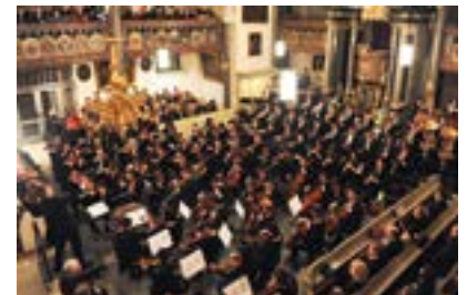
Bayreuth, Osterfestival

Bayreuth (FR/1.113 Zeichen). Vom 25. März bis 3. April 2016 findet das Bayreuther Osterfestival wieder an verschiedenen Konzerten in Bayreuth statt. Das traditionelle Symphoniekonzert am 27. März 2016 in der Ordenskirche steht dabei im Zeichen des 100. Todestags des Komponisten Max Reger. Das große Symphonieorchester der Internationalen Jungen Orchesterakademie spielt neben Regers Ballett-Suite an diesem Abend auch Brahms vierte Symphonie und Schubert-Lieder wie „Gretchen am Spinnrade“ oder den „Erlkönig“. Außerdem sind Max Regers Werke beim Eröffnungskonzert in der Stadtkirche (25. März 2016) und beim Konzert „Krückl and Friends“ in der Schlosskirche (1. April 2016) zu hören. Freuen darf man sich zudem auf Matineen mit Werken von Liszt, Schumann und Mendelssohn am Liszt-Flügel im Rokoko-Saal von „Steingraeber & Söhne“ (26. März 2016) sowie am gleichen Ort auf Musik von Brahms und Prokofiev (2. April 2016). Ganz andere Klänge genießt man bei der Jazz-Night am 2. April 2016 im AUDItorium, bevor der Jazz-Brunch am 3. April 2016 im VWtorium mit lateinamerikanischen Klängen das Osterfestival beschließt ( www.osterfestival.de ).