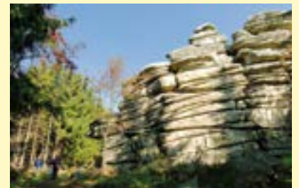
Fichtelgebirge, Felsengruppe Rudolfstein

Dafür schlägt man gerne auch einmal ungewöhnliche Wege ein, und einer davon führt ab Frühjahr 2016 auf den neuen Baumwipfelpfad in Ebrach im Steigerwald. Rund 1.100 Meter ist der Weg lang, das besondere ist aber seine Höhe. Zunächst wandert man 24 Meter über dem Erdboden, um dann an der Außenseite eines Holzturmes bis zu 40 Meter in die Höhe zu steigen und den fantastischen Ausblick zu genießen ( www.baysf.de/de/wald-erkunden/baumwipfelpfad-steigerwald ). Den Blick in den Himmel zu richten, lohnt sich besonders nach Sonnenuntergang in der Rhön.