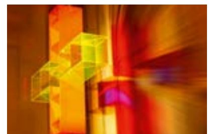
Würzburg, Kreuz „Himmelsleiter in Bewegung“