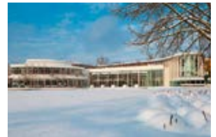
Coburg, Kongresshaus