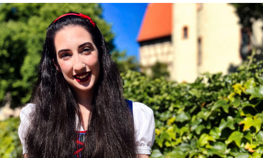
Schneewittchen vor dem Lohrer Schloss

Aufs Rad schwingen sich vom 8. bis zum 10. Mai 2026 die Teilnehmer:innen dieser Gruppen-Pressereise: Mit E-Bikes erkunden sie auf dem „MainRadweg“ und dem „Tauber Altmühl Radweg“ das Spessart-Mainland und das Liebliche Taubertal und machen Station in der Geschichte und Genusskultur dieser Urlaubslandschaften.