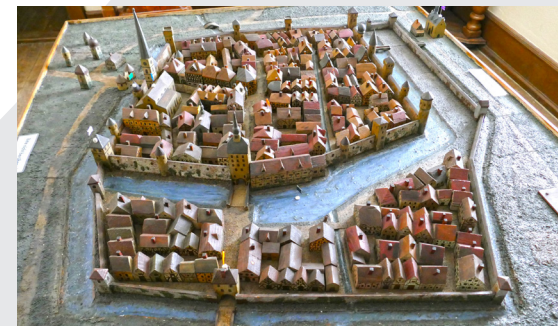
Stadtmodell im Heimattmuseum von Lauda-Königshofen

www.spessart-mainland.de www.liebliches-taubertal.de