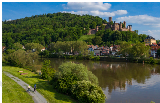
Am Wertheimer Mainufer

Der nächste Tag startet mit dem Rundgang durch das Museum Obertor-Apotheke , bevor die Gruppe auf dem „MainRadweg“ Richtung Wertheim und damit ins Liebliche Taubertal radelt. Dort wechseln sie nach einer Stärkung auf den „Tauber Altmühl Radweg“. Am Kloster