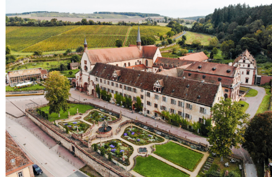
Kloster Bronnbach

Bronnbach steigen die Radler:innen für eine Führung durch dessen barocke Pracht aus dem Sattel.